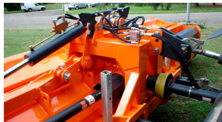
Гідравлічно-складна рама. Ширина в складеному стані: 2 473 мм